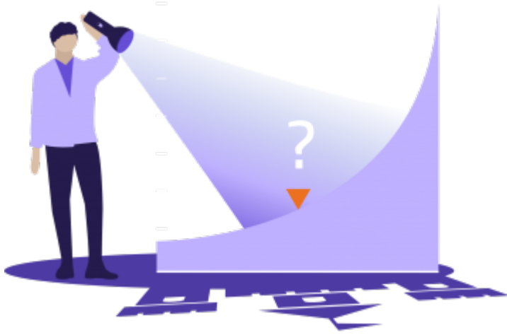
Illustration / © Benjamin Mispoulet pour l'Observatoire des inégalités

Êtes-vous fortuné ? La moitié des Français possèdent un patrimoine net (dettes déduites) inférieur à 94 250 euros par adulte, un tiers n'a pas plus de 21 300 euros. Avec 233 000 euros, on entre dans le club des 20 % les plus fortunés. Les fortunes montent très haut. Au sein du 1 % le plus fortuné, les échelons atteignent des millions d'euros.